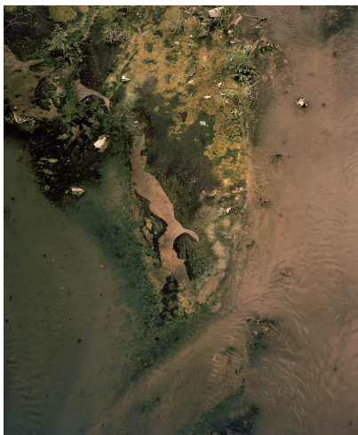
„Sewer“, 2017, C-print, 62,5 x 50 cm