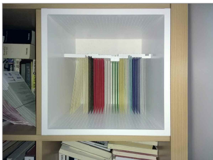
„Bücher“, 2018, Mischtechnik aus MDF, Garn 35 x 35 x 35 cm